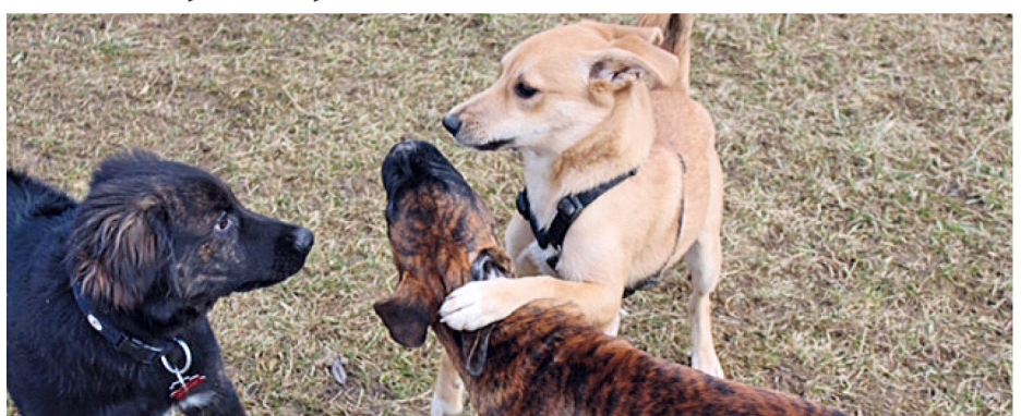
... am Dachauer Leitenberg, dienen der Sozialisierung des Welpen – und machen Spaß!